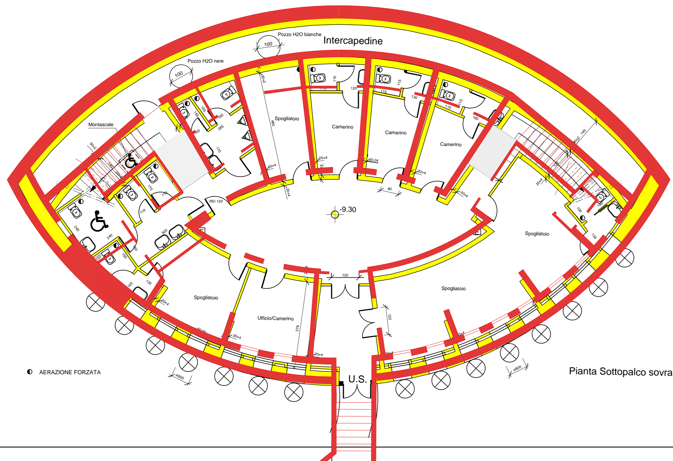
Pianta Sottopalco sovrapposizione